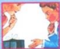
В МАГАЗИНЕ- ПРОДАВЦУ