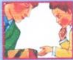
В ТРАНСПОРТЕ- ВОДИТЕЛЮ