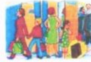
В ОБЩЕСТВЕННЫХ МЕСТАХ