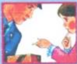
НА УЛИЦЕ ИЛИ В МЕТРО- ПОЛИЦЕЙСКОМУ